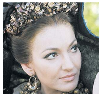
Maria Callas in "Medea"