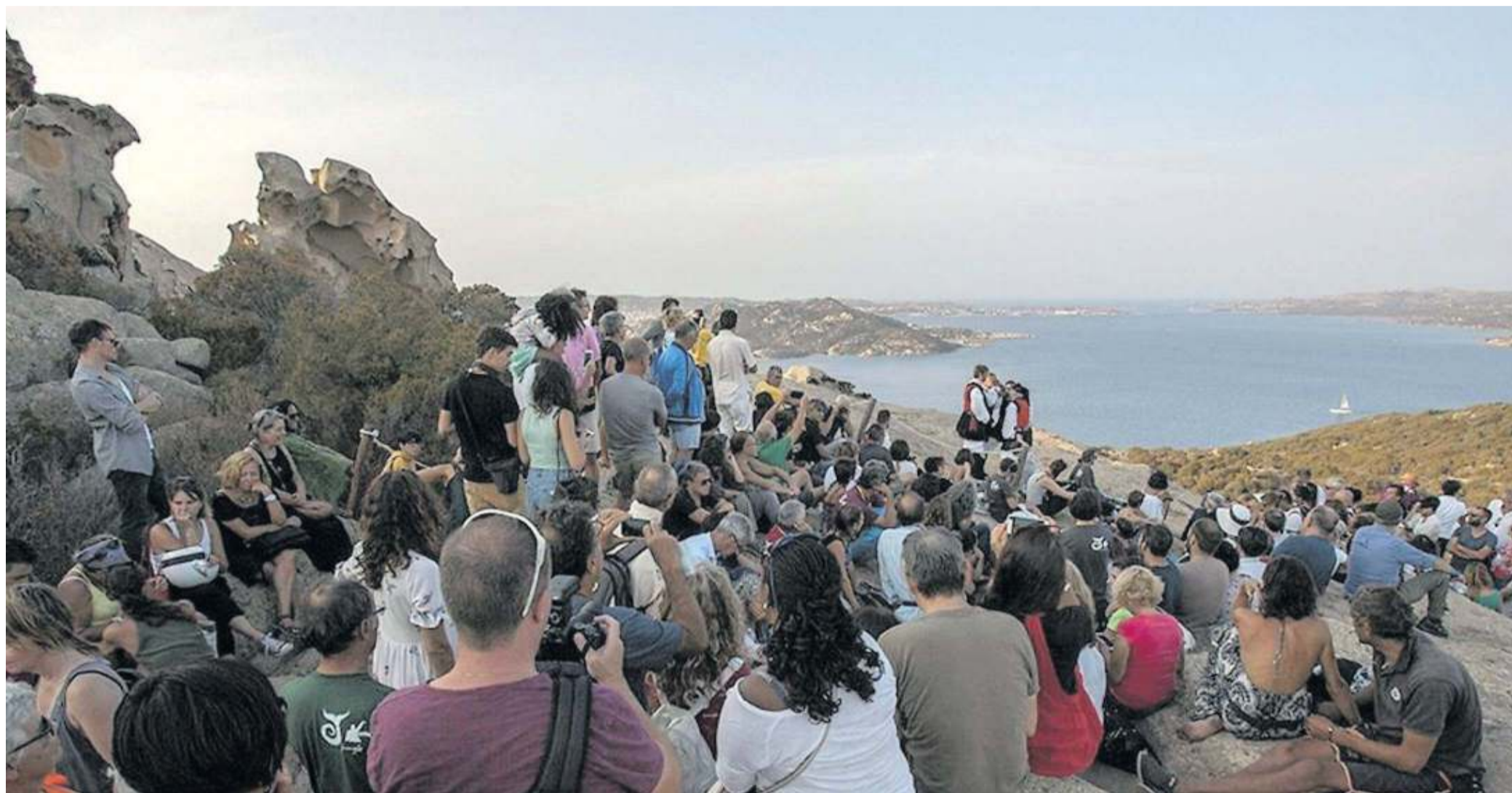
Uno dei concerti in spiaggia del festival "Isole che parlano" che si è concluso domenica a Palau con un suggestivo saluto al mare