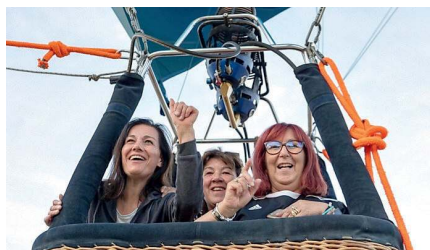
Il programma è visionabile sul sito esperienzefestival.it, l'obiettivo specifico del progetto del Gal è potenziare e sviluppare l'attività e l'attrazione turistica delle acque interne della Barbagia

Tra le attività proposte via terra sarà possibile partici-