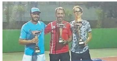
I finalisti del torneo Rodeo Delcomar