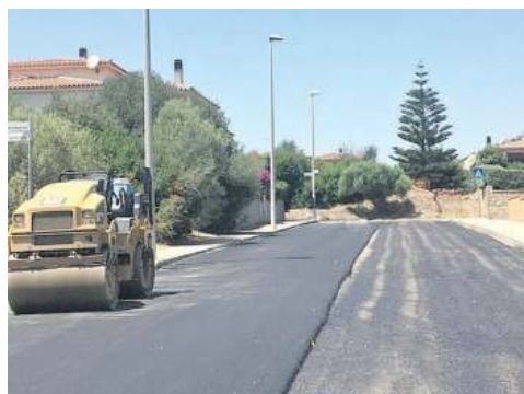
Una delle strade su cui il Comune sta intervenendo con il nuovo asfalto

Arzachena, investimento del Comune sul centro abitato ma anche sulle frazioni e gli altri borghi