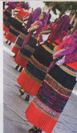
Sopra: la sfilata in costume tradizionale alla Sagra del Redentore di Nuoro. In alto: l'incontro tra arte e natura è al centro del festival Isole che parlano di Palau.

*** SEDILO (Oristano) 6 e 7 luglio Ardia (festa tradizionale) Dal ricco patrimonio culturale si passa alla realtà intensa e dirompente delle cavalcate che caratterizzano l'Ardia di Sedilo, una delle esperienze più forti offerte dal territorio del Barigadu. Anche Walt Disney ne rimase conquistato e la descrisse come «un grande carosello con grida e fucilate